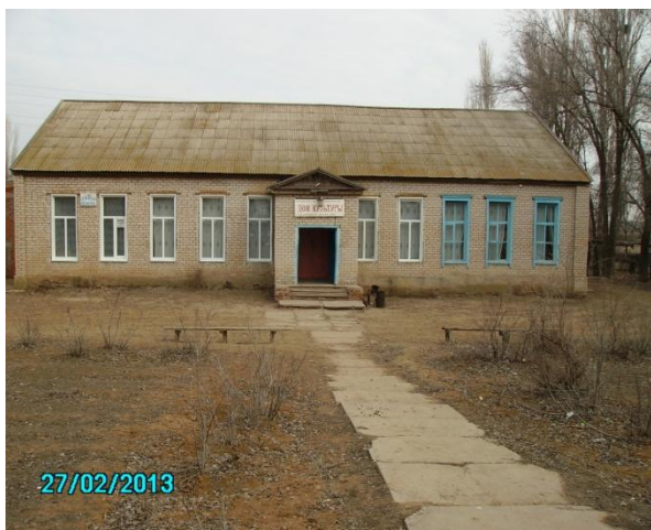
Здание Дома Культуры