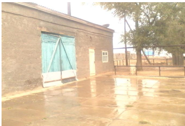
Здание пожарной охраны

В территории селе функционируют сбербанк, ветеринарный участок, пожарная охрана,