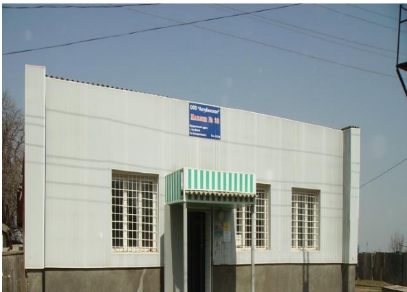
Магазин ООО «Павлова»