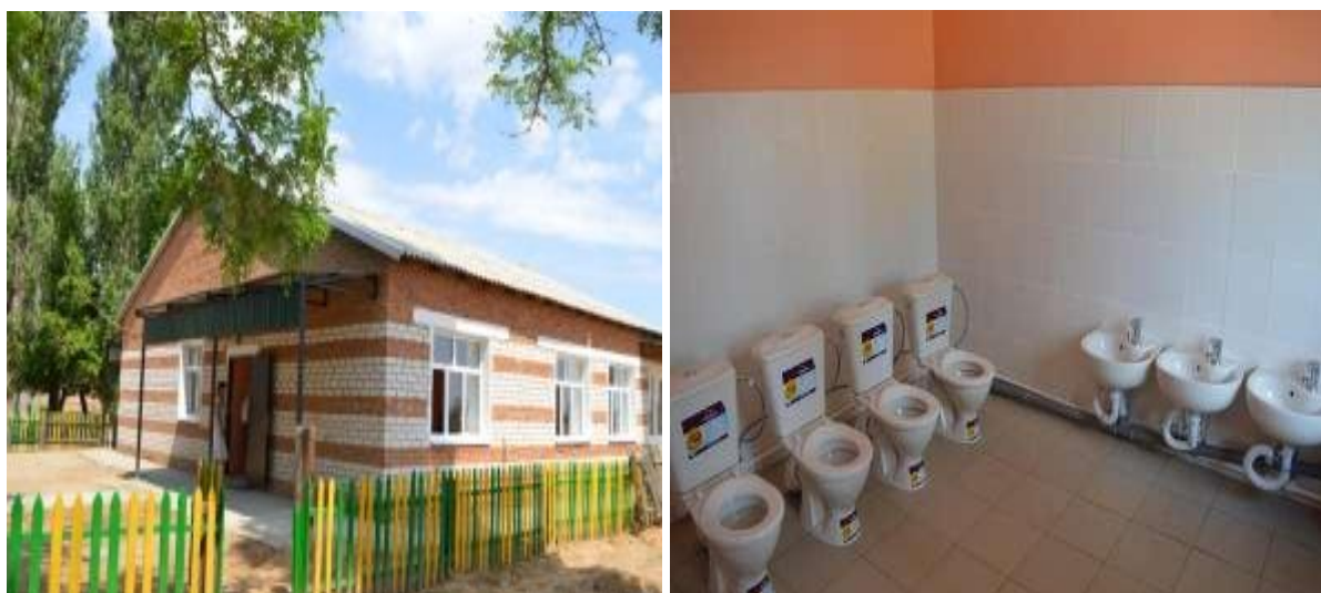
Детский сад «Светлячок»

Педагогические работники прошли дополнительное педагогическое образование.