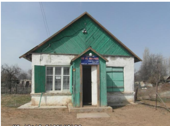
Магазин № 28 «Плодосовхоз»