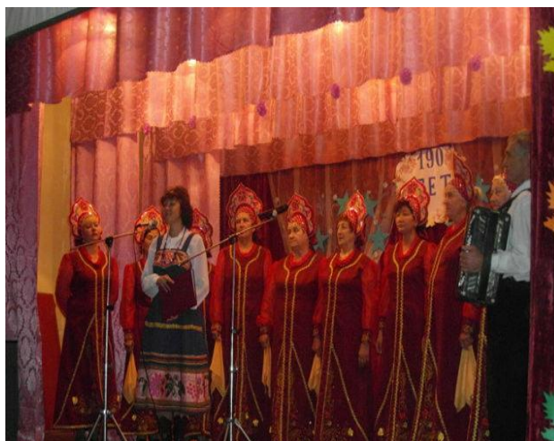
Вокальная группа «Сельские зори»